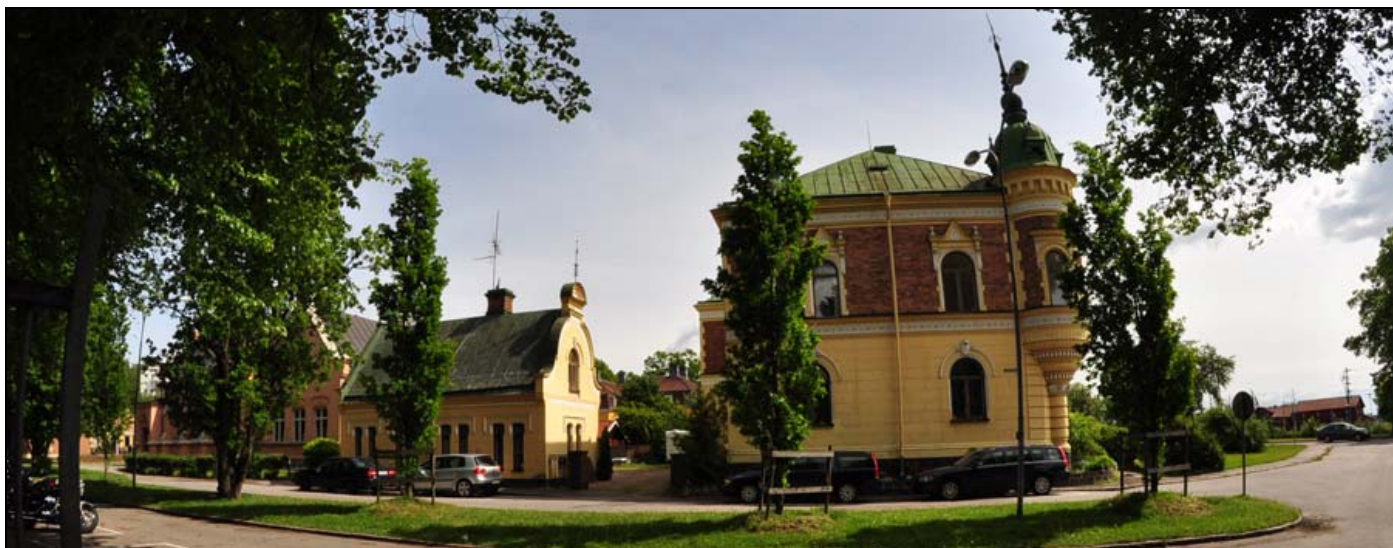
Lyckholmska villan på Engelbrektsplan 1 i Köping uppförd 1890, i annexet till vänster hade Theodor Dahl sin ateljé..

Genom en slump fick Theodor Dahl kontakt med en köpingsbo som ordnade så att han fick i uppdrag att rita ett nytt apotekshus. Theodor Dahl fanns således redan på plats när Köping brann i juli 1889. Under några hektiska år ritade han många hus som fortfarande finns kvar. Till exempel den vackra Lyckholmska villan, där Dahl hade sin ateljé på gården.