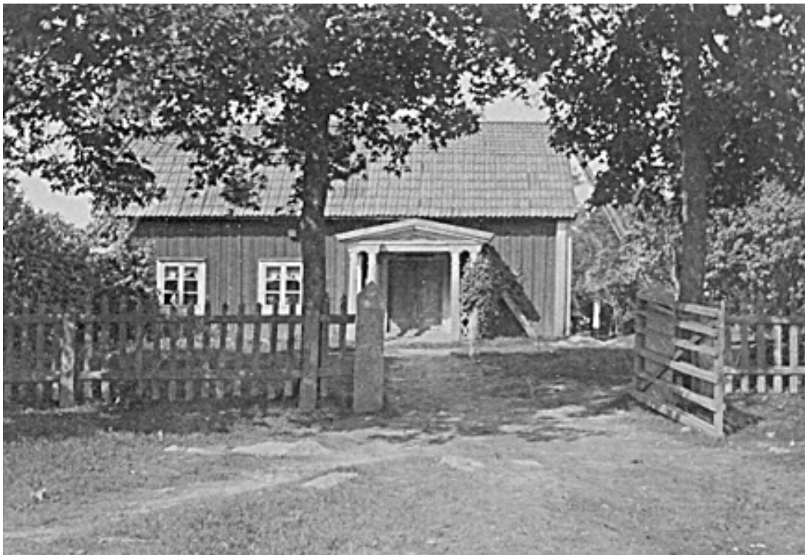
Mangårdsbyggnad i Håskesta

Kittelgubben kommer och tar er var mer än tillräckligt som förmaning, för att få det mest bångstyriga barn att ta reson.