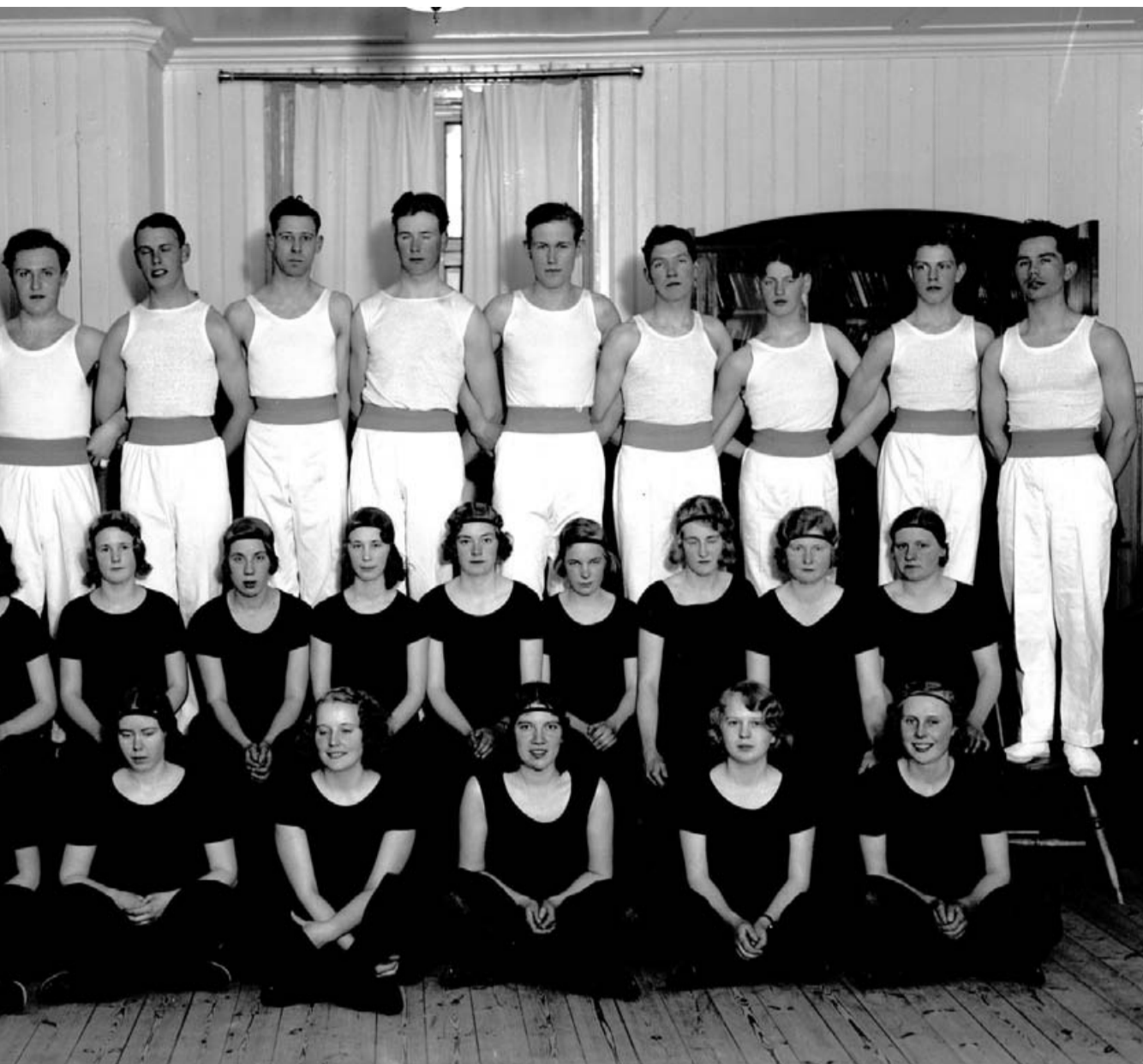
...äck, fotograferad av Gustaf Åhman 1932.