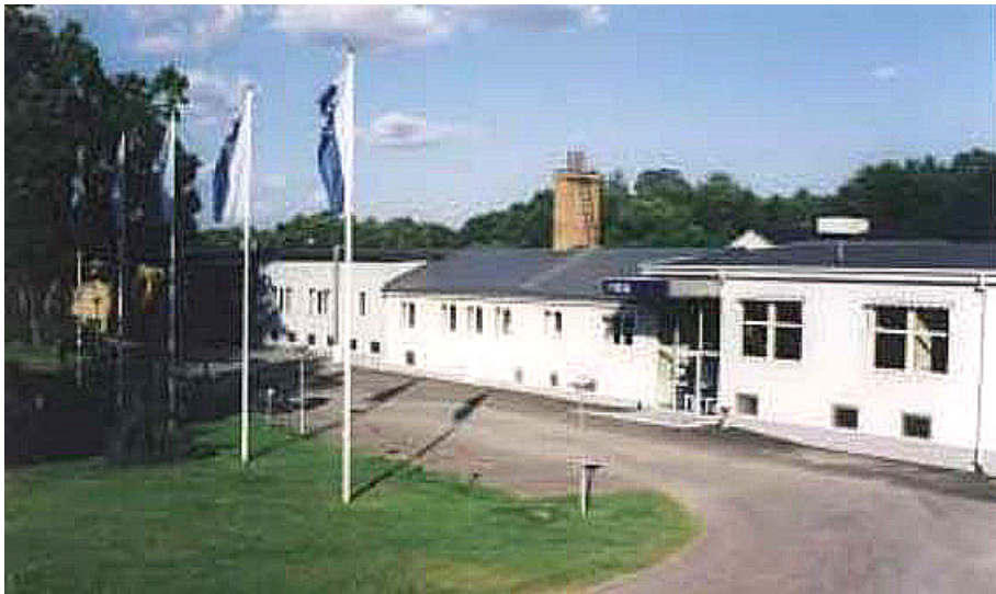
Fabriken efter tillbyggnad 2002