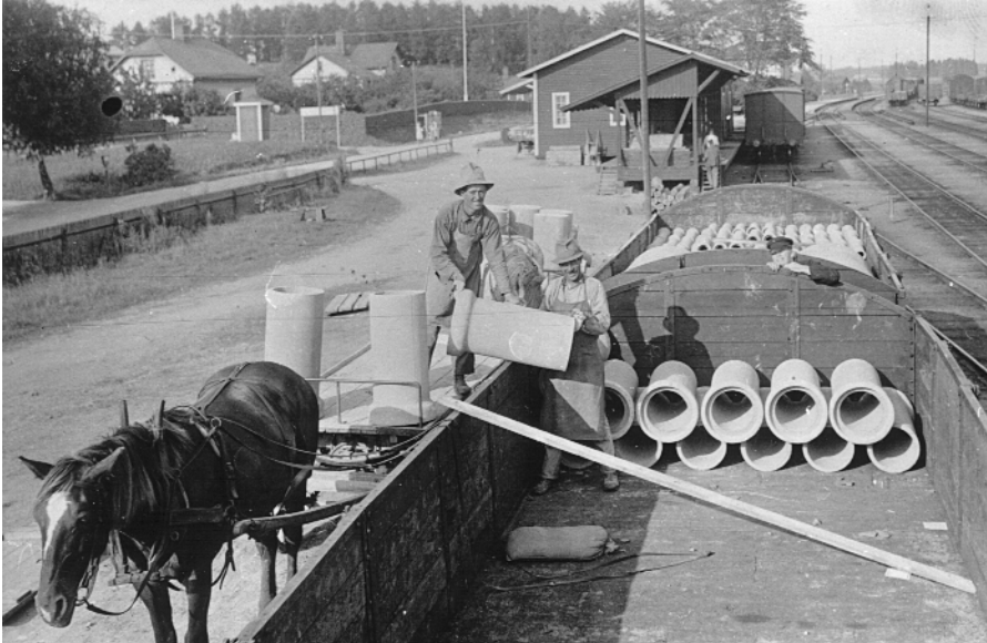
Vid järnvägens fraktgoodsavdelning 1936

Fabriken är försedd med cementgjuterimaskiner av senaste konstruktioner och verksamheten omfattar tillverkning av olika slags cementrör för avloppsledningar i alla förekommande dimensioner samt massartiklar i betong.