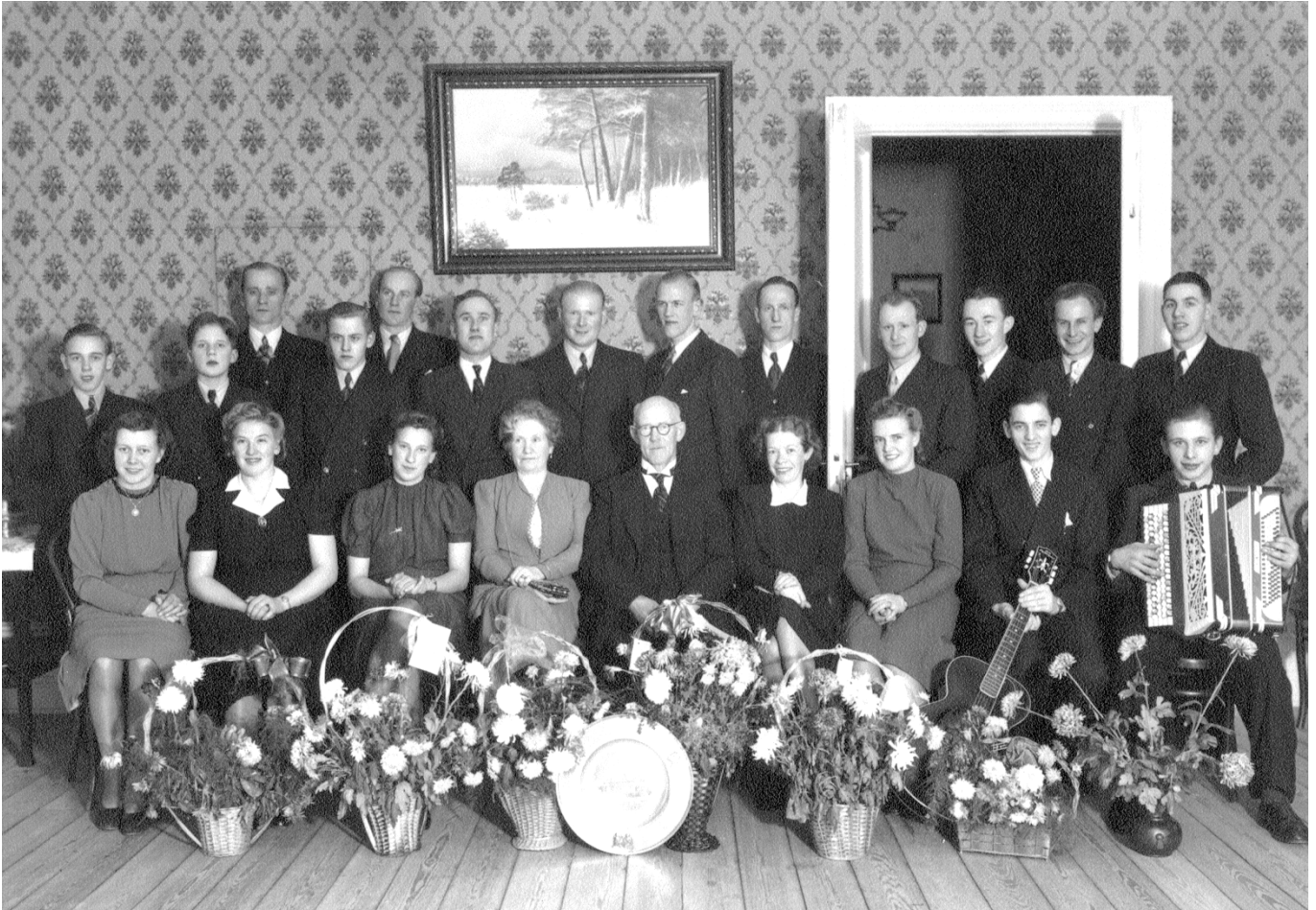
Nordvalls Metallfabrik Gjuterivägen Kolbäck.