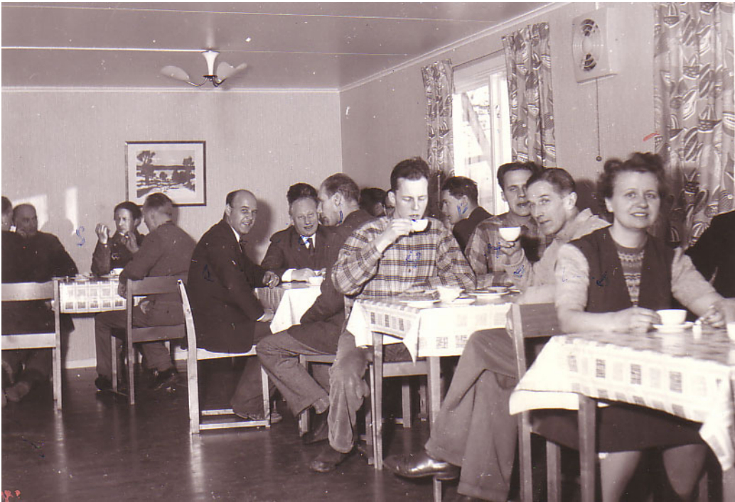
Invigningen av lunchrummet i Kvarnfors.