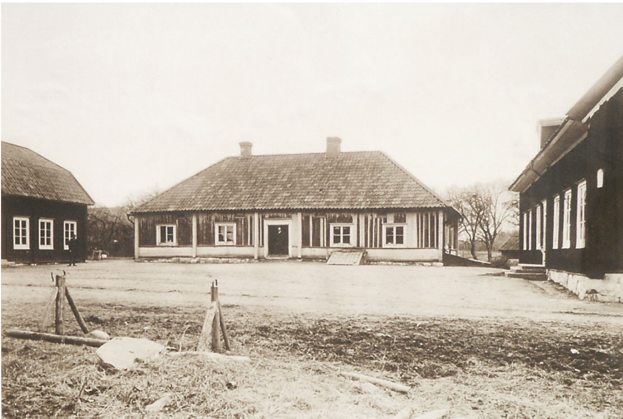
Gästgivaregården i början av 1890-talet.