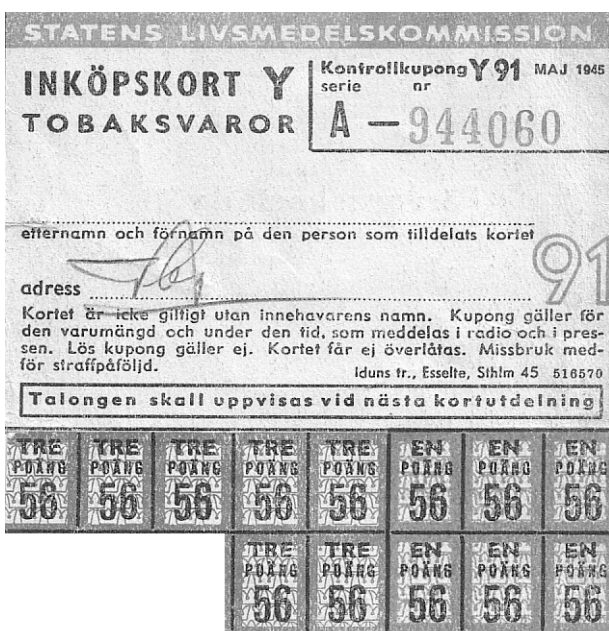
Ransoneringskort från maj 1945