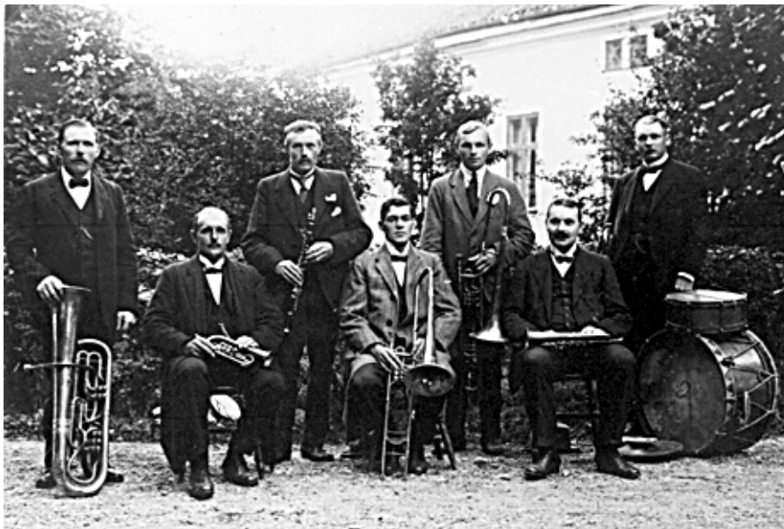
Mölntorp på 1930-talet