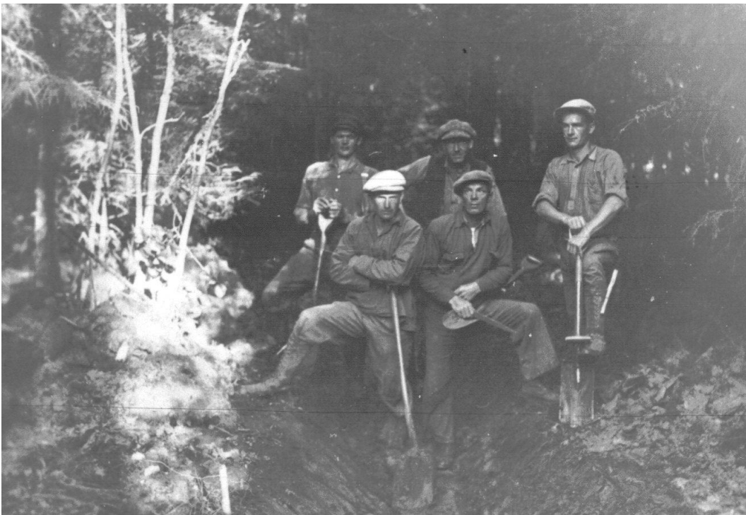
Beredskapsarbetare från 1933.

Socialdemokraterna fick regeringsmakten efter 1932 års val. Arbetsmarknadsläget förbättrades efter 1933 då den socialdemokratiska regeringen gjorde upp med bondeförbundet i den så kallade "Kohandeln". Nödhjälpsarbetena ersattes av beredskapsarbeten med avtalsenliga löner.