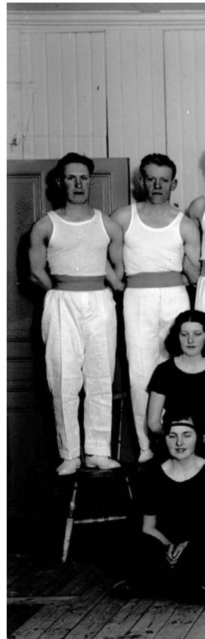
Rakryggade. En gymnastikgrupp i Kolbäck.