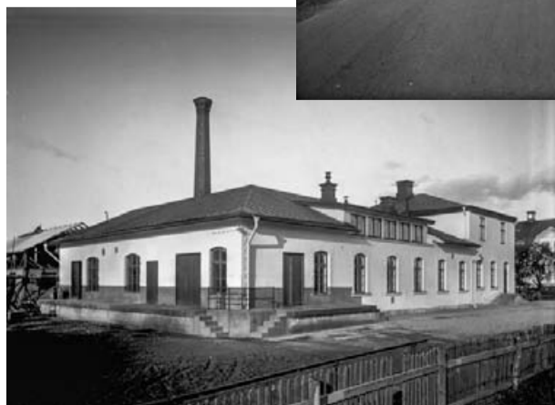
Kolbäcks mejeri. Den 30 mars 1957 levererades den sista mjölken till mejeriet. Bilden är tagen 1932.