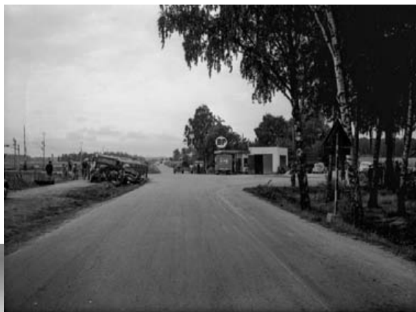
Olycka vid Nybro. En kollision mellan två bilar vid utfarten från Kolbäck mot Köping. BP-macken byggdes på 1930-talet. Bilden är tagen 1950.